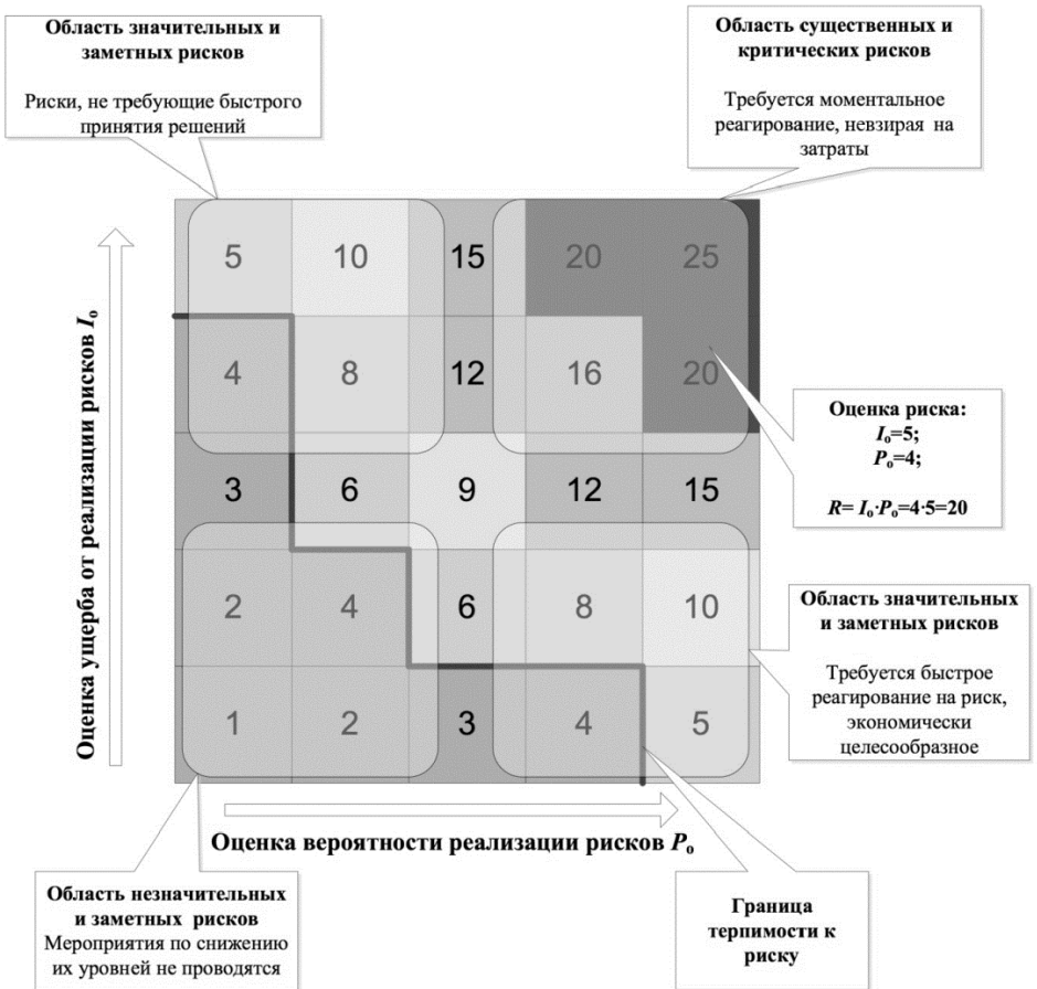
Рис. 2. Карта проектных рисков

В процессе расчета следует оперировать оценками вероятности и ущерба в баллах, а не суммами потерь в денежном выражении и численными значениями вероятности риска. Значение оценки риска проекта R определяет его вес, а баллы вероятности и ущерба — координаты на карте рисков (рис. 2).