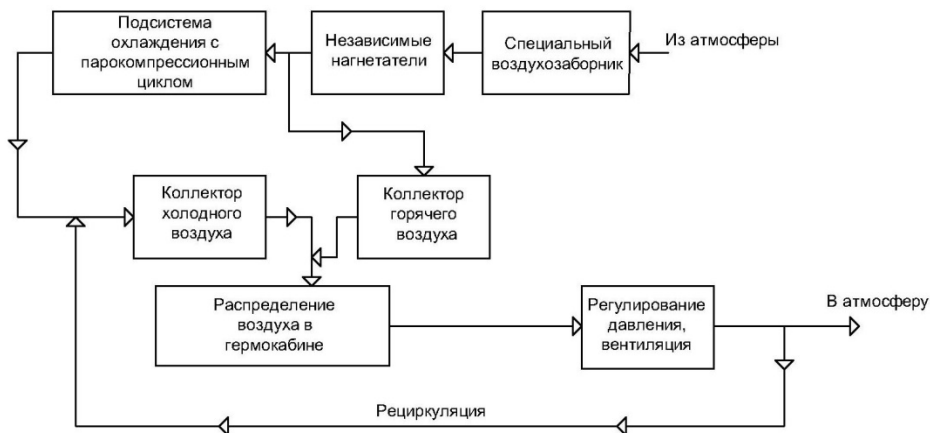
Рис. 2. Вариант структурной схемы СКВ с независимыми нагнетателями

конструкцию и условия эксплуатации. По сравнению с компрессором двигателя ЛА используемые центробежные компрессоры имели более низкий КПД и были менее надежны [3]. На рис. 2 показана структурная схема СКВ с независимыми нагнетателями.