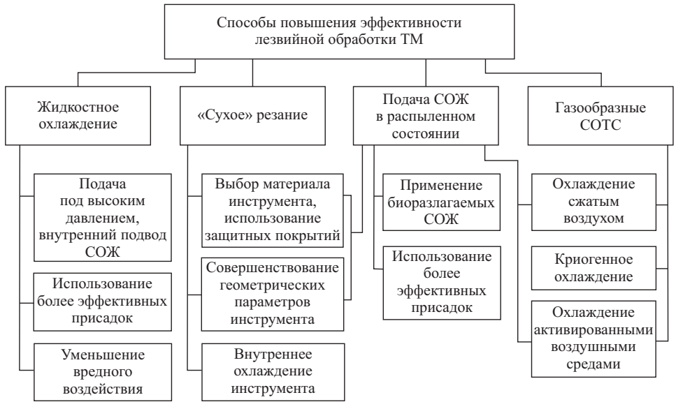
Рис. 3. Классификация способов, повышающих эффективность лезвийной обработки ТМ

Выбор конкретного типа СОТС и способа подачи зависит от обрабатываемой детали, инструмента и оборудования, на котором проводится обработка. В разных отраслях промышленности предъявляются свои определенные требования к качеству обработанной поверхности деталей и технологическому процессу. В связи с этим важно понимать, в каких границах возможно рациональное применение выбранного СОТС с учетом особенностей отрасли, оборудования, обрабатываемого материала и требований к деталям.