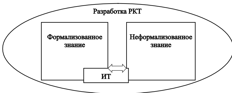
Рис. 1. Поддержка знаний информационными технологиями

В настоящее время при разработке РКТ возможности ИТ для поддержки знаний используют в основном таким образом, как показано на рис. 1. Перекос ИТ в сторону формализованного знания отражает типичную несбалансированность проекта информатизации, причины которой будут указаны далее.