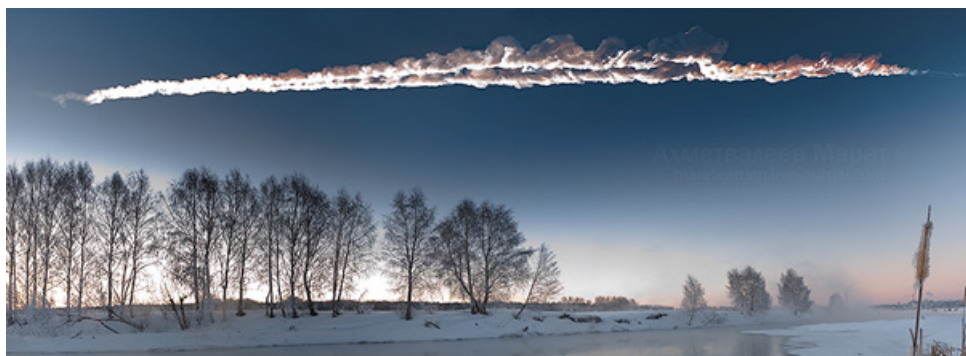
Рис. 8. След Челябинского метеороида при виде с Земли

Известное фото на рис. 7 демонстрирует довольно густую тень от следа Shuttle, которая проецируется на заходе Солнца прямо на Луну [60]. А про след Челябинского метеороида (рис. 8 [61]) можно только сказать, что он был поистине роскошен.