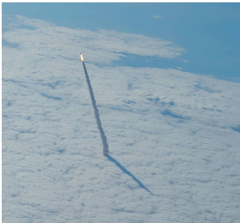
Рис. 6. След Space Shuttle на фоне облачности

Поэтому определим все параметры, входящие в формулу (4), и с ее помощью оценим возможные границы их вариаций. Для этого осталось найти уровень оптической толщины (толщи) следа выхлопа системы Space Shuttle. Рассмотрим еще одну фотографию его старта на фоне облачности (рис. 6) [58].