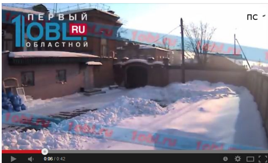
Рис. 2. Пятно соляризации на изображении вспышки Челябинского метеороида

результат пересвечивания матрицы камеры видеонаблюдения, как и на рис. 1, и один из двух известных автору настоящей статьи случаев фиксации этого явления на кадрах взрыва Челябинского метеороида. Этот факт снова и явно указывает на то, что видеокамеры работали тогда на пределе и за пределами своих расчетных характеристик, и по изображениям, полученным ими, нельзя каким-либо способом определить яркость вспышки. Поэтому данные по яркости, полученные авторами [5, 6], не могут считаться достоверными из-за предельной яркости вспышки для таких камер на рассматриваемых дистанциях от вспышки. Кроме того, по причинам, указанным в начале этой рубрики, оценки энергии взрыва метеороида на основе этих данных тем более не могут приниматься во внимание.