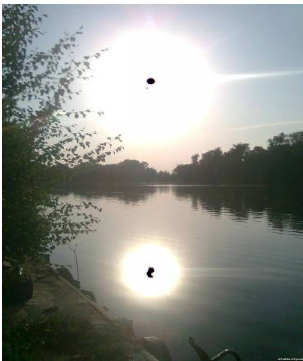
Рис. 1. Пятна соляризации на изображении Солнца и на его отражении в воде

И, наконец, главное. В принципе невозможно, используя данные видеокамер и видеорегистраторов, получить правильную оценку интенсивности света, излучаемого вспышкой, яркость которой многократно превосходит яркость Солнца. Как известно, при фотографировании Солнца с помощью современных фотоаппаратов и видеокамер происходит соляризация — на изображении возникают фиолетовые или черные пятна вследствие так называемого пересвечивания (полной потери чувствительности) соответствующих участков воспринимающей свет матрицы. И подобный эффект можно наблюдать не только при наведении камеры на Солнце, но даже и на его отражение, например, в водах Днепра в окрестностях Херсона [18] (рис. 1).