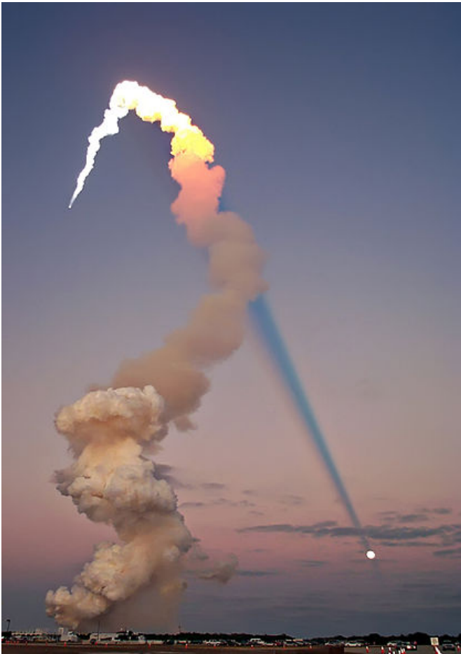
Рис. 7. Тень от следа Space Shuttle

Опираясь на полученную информацию, перейдем к рассмотрению следа Челябинского метеороида. Имеются фотоснимки на просвет лучами Солнца его и только что рассмотренного выше следа Shuttle (рис. 7–9).