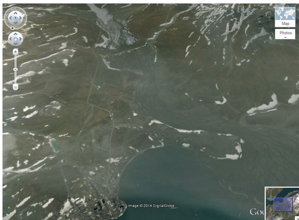
Рис. 3. Окрестности пос. Северный на южном берегу пролива Маточкин Шар

1. Дистанция 53,5 км — это расстояние от эпицентра взрыва до пос. Лагерный (около 73,39° с. ш., 54,74° в. д.), который был построен летом 1955 г. на южном берегу пролива Маточкин Шар для переселения туда всех охотников-промысловиков архипелага Новая Земля в связи с открытием Новоземельского испытательного полигона [29]. К осени 1961 г. все жители поселка были эвакуированы, а сам поселок, застроенный стандартными щитовыми домиками, полностью разрушен при испытаниях 30 октября 1961 г. боезаряда АН602.