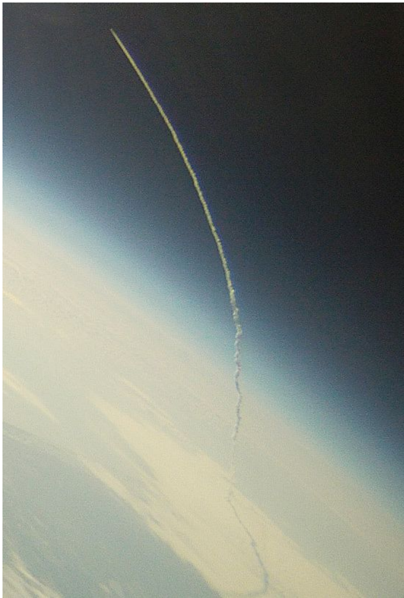
Рис. 5. След Space Shuttle перед отсечкой твердотопливных ускорителей

Этот след почти целиком состоял из аэрозолей, выброшенных двумя твердотопливными ускорителями SRM, которые работали от старта до высоты около 45 км. По наклону следа (см. рис. 5) в верхней точке (при отделении SRM угол наклона траектории к горизонту составляет 28^\circ ) можно заключить, что здесь запечатлен момент незадолго до отсечки ускорителей, и след виден почти полностью — от начала и практически до конца. По этой фотографии можно также заключить, что оптические характеристики следа изменяются слабо —