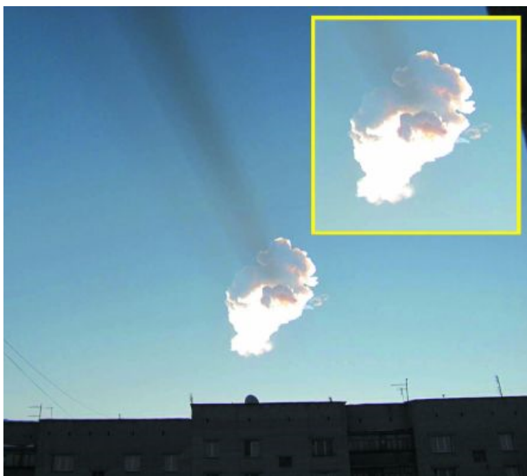
Рис. 9. Тень от следа Челябинского метеороида

Однако аналогичное просвечивание следа Челябинского метеороида на восходе Солнца явно свидетельствует о том, что его оптическая толщина (рис. 9 [62]) на самом деле очень невелика и многократно ниже, чем у следа Space Shuttle. Правда, при этом он превосходит последний на половину порядка по длине и на порядок с лишним по поперечным размерам.