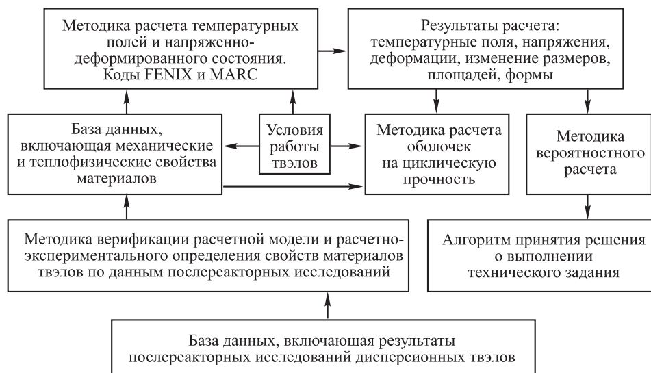
Рис. 1. Расчетная модель твэла

На всех этапах разработки твэлов основным инструментом, позволяющим анализировать экспериментальные данные, оптимизировать конструкцию и обосновывать ресурсные характеристики с учетом реальных условий эксплуатации, является расчетная модель твэла. Расчетная модель дисперсионных твэлов состоит из комплекса взаимосвязанных верифицированных методик и свойств материалов твэла, используемых при расчетах (рис. 1).